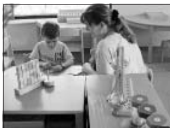
Schrift- und Zahlenwelt

Bis 2009 sah bei uns jeder Gruppenraum ähnlich aus. Er beinhaltete z.B. eine kleine Puppenecke, einen Bauteppich, einen Maltisch und viele Tische für Brettspiele und zum Frühstück. Über 3 Jahre lang spielten ca. 25 Kinder im Alter von 3 - 6 Jahren mit ihren Erziehern vorwiegend in einem 51 m 2 großen Gruppenraum, solange, bis sie als Schulkinder den Kindergarten verließen. Inzwischen nützen die Kinder während ihrer mehrjährigen Aufenthaltszeit alle Räume, wobei jeder Raum ein großzügiges und inspiratives Angebot eines Bildungsbereiches bietet - es gibt nun mehrere Bildungswelten in unserem Kindergarten: