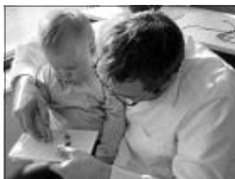
Spiel- und Bastelwelt