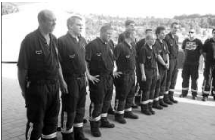
Alle bestanden , herzlichen Glückwunsch