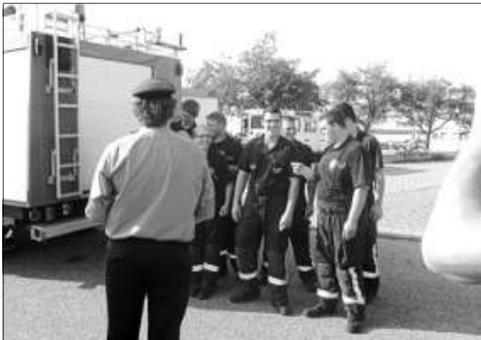
Auslösung der Funktionen

LEISTUNGSABZEICHEN IN BRONZE FÜR DIE FREIWILLIGE FEUERWEHR FRIOLZHEIM !!!