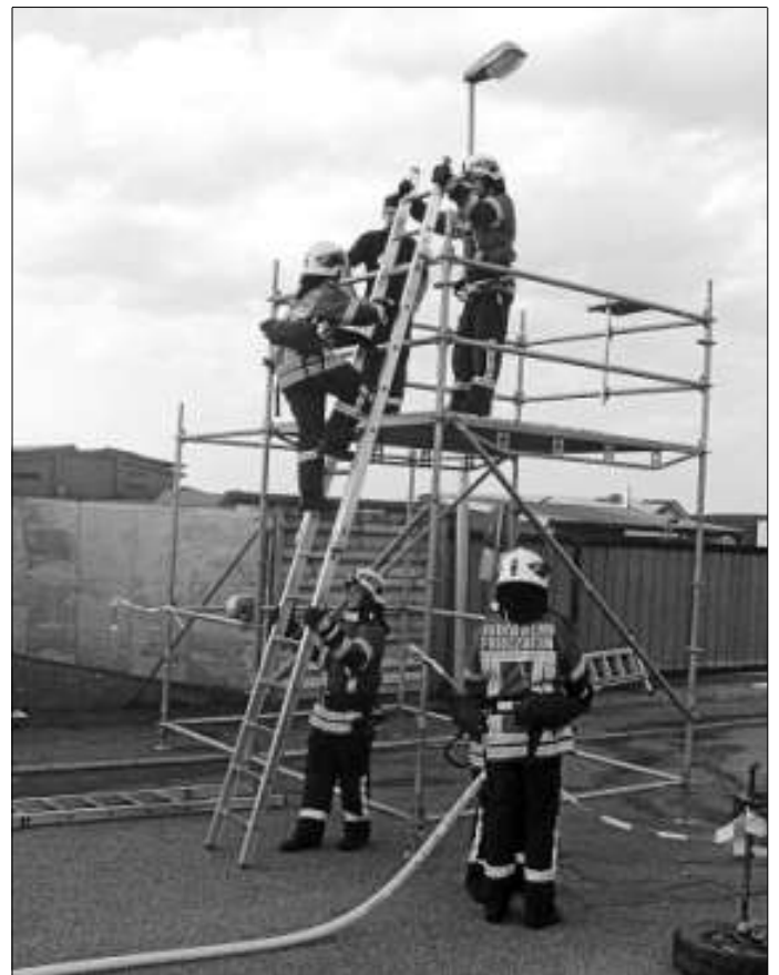
Rettung der Person