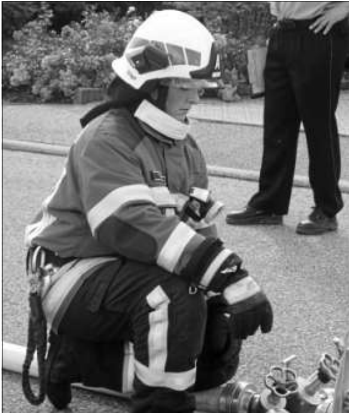
Konzentriert bei der Arbeit