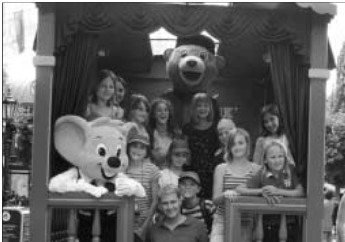
Glückliche Friolzheimer Kinder im Europapark

In Deutschlands größtem Freizeitpark wurden wir mit Kaffee, Saft und Kuchen sowie einer Vorführung atemberaubender Jonglage - und "unsere" Kinder mittendrin - empfangen. Dieser Auftakt eines sehr erlebnisreichen Tages wurde nicht nur mit Achterbahnfahrten, "Schlittenfahrten", Laserlabyrinthen und viel Spaß fortgesetzt. Es wurden ein Festumzug bestaunt, sämtliche Länder Europas "durchreist" und einige besonders Mutige trauten sich sogar Deutschlands schnellste Achterbahn "Silver Star" zu. Erst um kurz vor 20 Uhr konnten müde und glückliche Kinder nach einem erlebnisreichen Tag wieder von ihren Eltern in Empfang genommen werden. Alle Bilder zum Kinderferientag gibt es unter www.cdu-friolzheim.de zum Download.