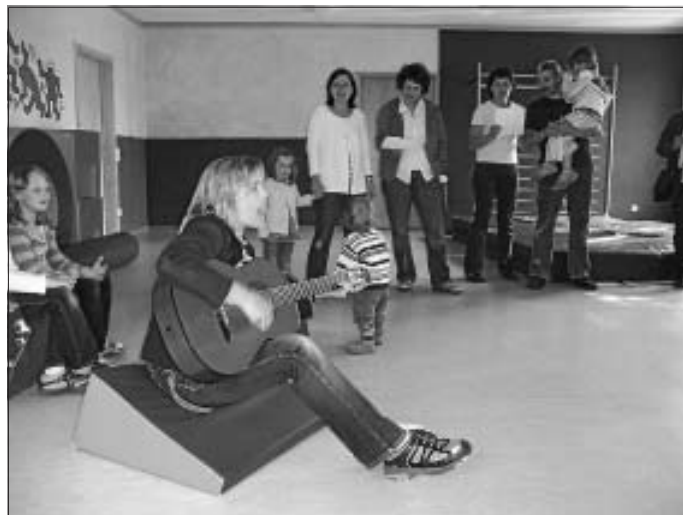
Der Elternbeirat der Gruppe 1

Frau Rüth wird nach den Sommerferien als Gruppenleitung in die Gruppe 6 wechseln, Frau Guerra wird ihre Tätigkeit zum großen Bedauern in einem anderen Kindergarten fortsetzen. Beiden wünschen wir hierbei einen guten Start und viel Erfolg.