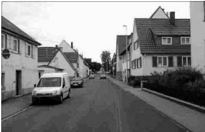
Ihre Gemeindeverwaltung Friolzheim

Wir danken allen Anwohnern für Ihr Verständnis und Ihre Rücksichtnahme während der Bauzeit!