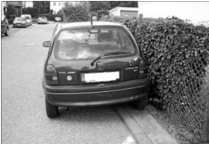
Beim Spielplatz Finkenstraße