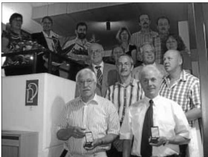
Die drei "neuen" Gemeinderäte

Er begrüßt die neuen Gemeinderäte und wünscht eine gute Zusammenarbeit.