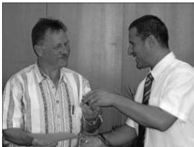
Ehrung für 50-maliges Blutspenden