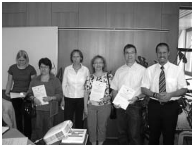
Die 10-maligen Blutspender/innen