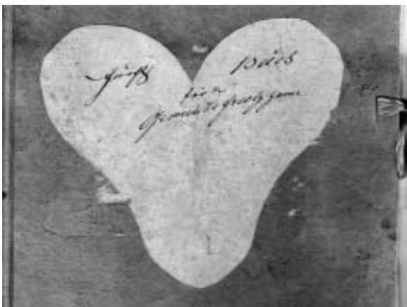
Ansicht Deckel des Furt - buches

Das Bürgerrecht konnten sich meistens nur Personen mit Grundbesitz oder anderem Einkommen leisten, hatten dann mehr Rechte aber auch mehr Pflichten.